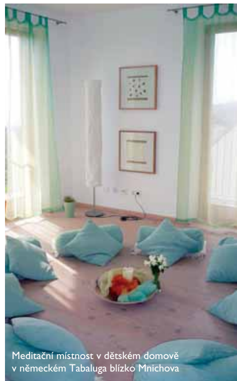
Meditační místnost v dětském domově v německém Tabaluga blízko Mnichova