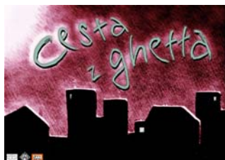
Obal hry Cesta z ghettá

„Neobvyklé je především prostředí, do něhož je hra zasazena - prostředí sociálního ghettá. Namísto zámků v ní najdeme polorozbořené domy, místo rytířů se hráči stávají chudými, dlouhodobě nezaměstnanými lidmi - bez prostředků a s mizivou životní perspektivou.“